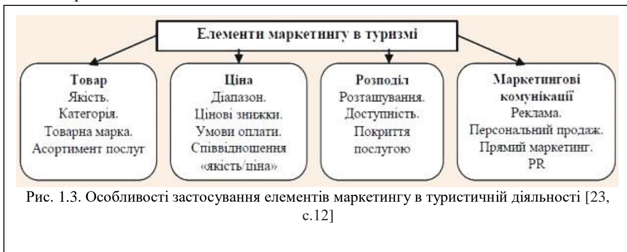
Рис. 1.3 – третій рисунок першого розділу. Номер рисунка, його назва і